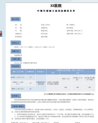
直接出具检测报告