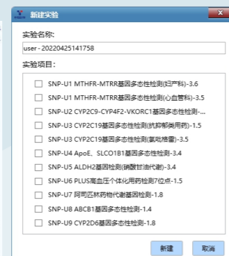
一键选择运行程序